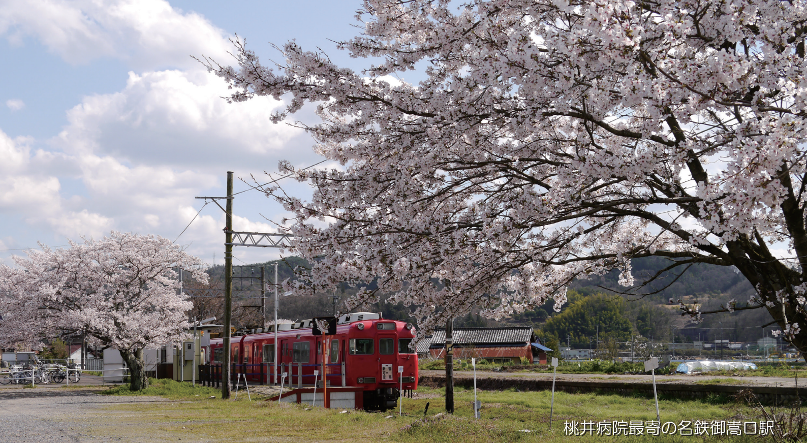
桃井病院最寄の名鉄御嵩口駅